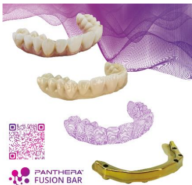
Fig. 1. Solution Panthera Fusion Bar MC