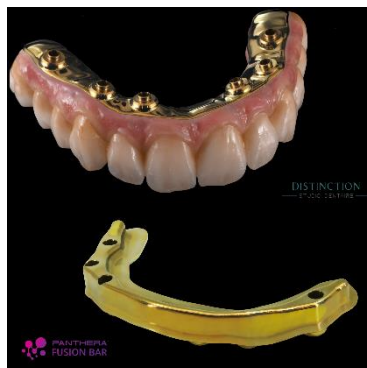
Fig. 2. Résultat final PFB